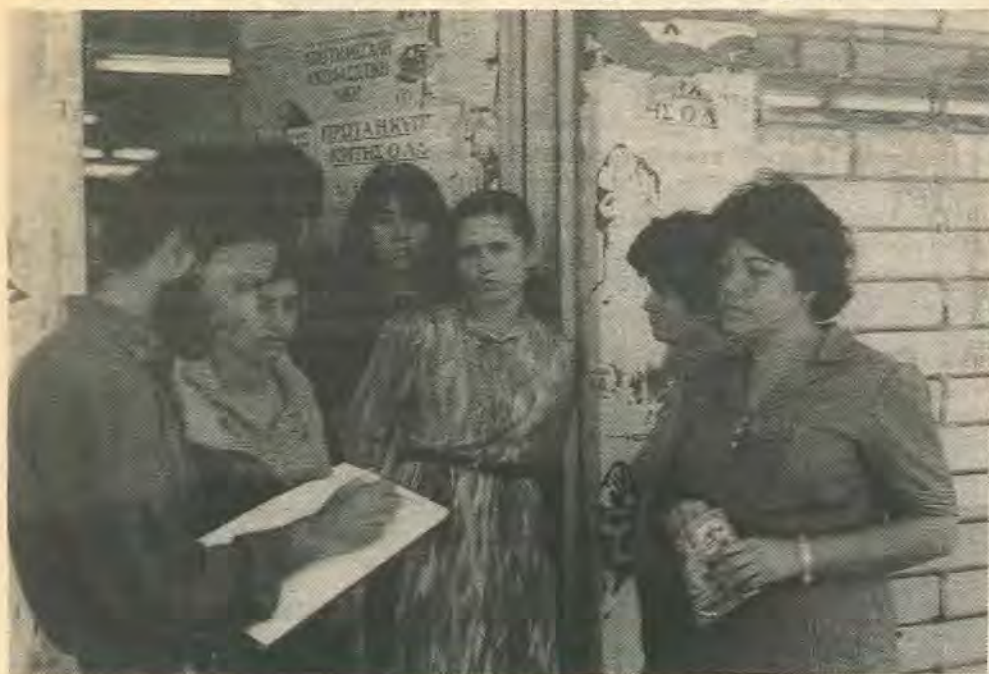
Οι εργάτριες στο εργοστάσιο Jet στη Δευτερα μιλουν σε συντάκτη της Σοσ. Έκφρασης.

Η Εταιρεία Jet, ένα απο τα μεγαλύτερα συγκροτήματα ένδυσης στην Κύπρο, απολύει απο τες 15 του Οκτώβρη πάνω απο 300 εργατες/τριες, λόγω, όπως